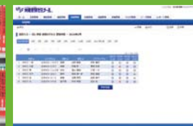
生徒管理システム