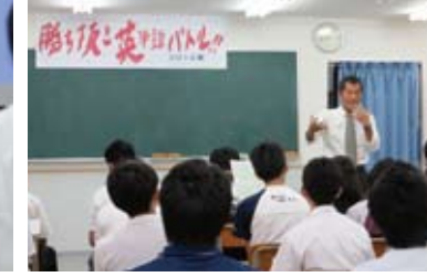
勝ち抜き英語バトル