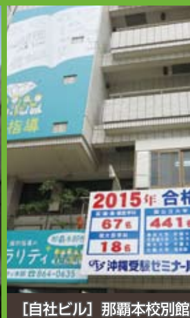
【自社ビル】那覇本校別館