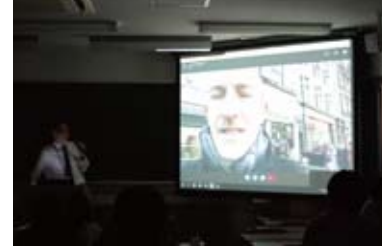
イギリスからの中継(遠隔授業)