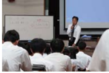
公立高校での大学入試説明会