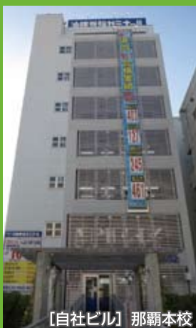
【自社ビル】那覇本校