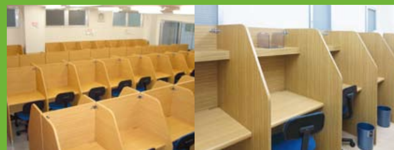
自習室も完備。もちろん、私語厳禁! 選抜Sクラス専用自習室(那覇 本校)

講師の熱意・ライバルの頑張りがダイレクトに伝わる環境が、生徒一人ひとりの“やる気”と“集中力”を高めます。