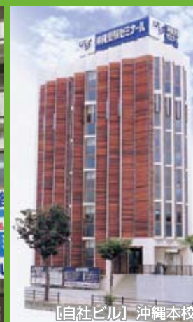
【自社ビル】沖縄本校