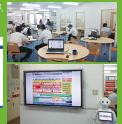
進化する沖ゼミ! 最新のIT技術を導入