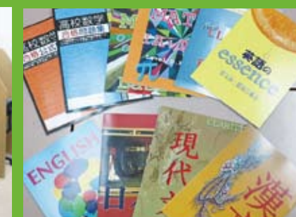
沖ゼミオリジナルのテキスト・ノート・CD