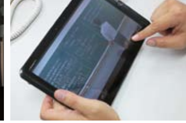
タブレットによる見直し学習