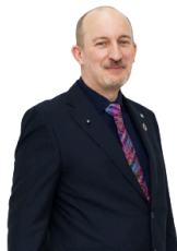
英語科 トレン校長