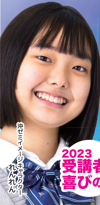
沖セミイメージキャラクター れんれん